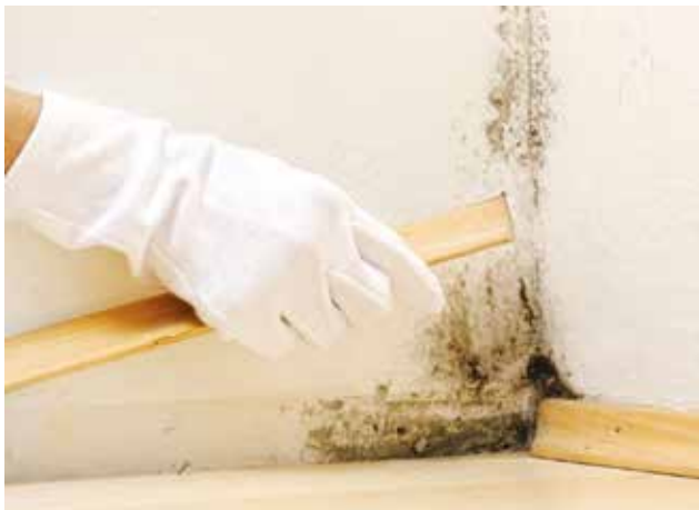
Parfois bien visibles, les moisissures peuvent aussi être cachées derrière une plinthe par exemple.

On peut également observer dans les logements humides une dégradation des colles des panneaux de particules (meubles...) avec dégagement de COV (par exemple le formaldéhyde).