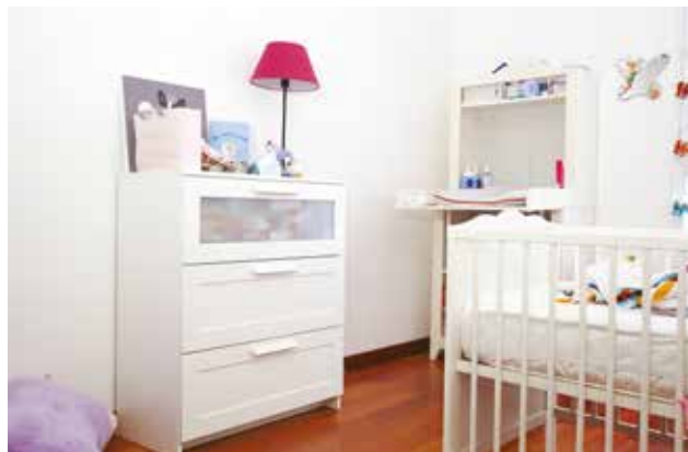
Si vous aménagez la chambre d'un bébé, faites-le bien avant sa naissance et aérez souvent pour évacuer les polluants émis par les meubles.

De même, une ventilation mal installée ou mal entretenue peut favoriser la présence de polluants dans le logement.