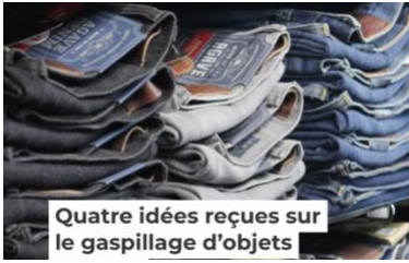
Quatre idées reçues sur le gaspillage d'objets

Trier, réemployer, réparer, entretenir : confinés, quatre conseils pour une consommation plus sobre