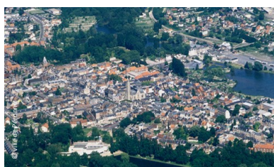
Péronne: réseaux énergétiques internes et externes