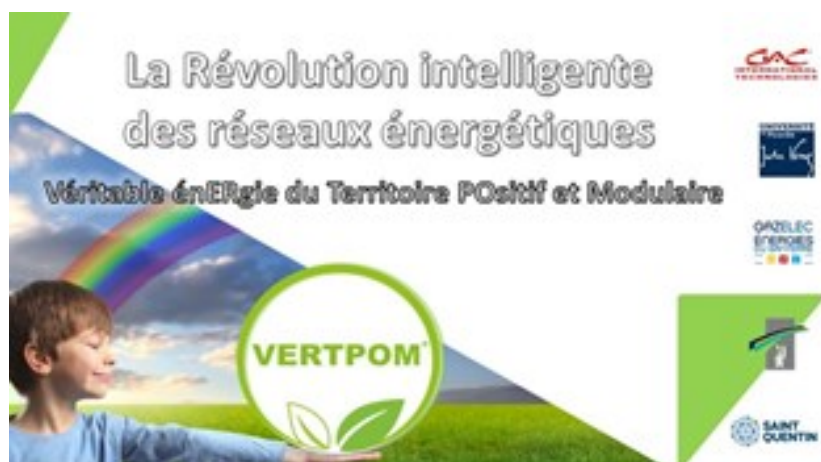
La banque de l'énergie VERTPOM Bank : La Révolution intelligente des réseaux énergétiques