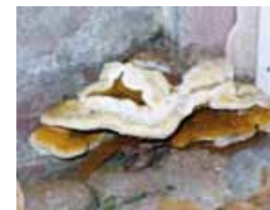
Sporophores de mérule

En raison du manque de connaissances concernant la nature et les effets sanitaires de la contamination fongique dans le milieu intérieur, une étude pluridisciplinaire in situ a été conduite dans des maisons touchées par la mérule pour décrire leur profil fongique détaillé, évaluer l'exposition des habitants aux mycotoxines , et caractériser les risques sanitaires toxiques.