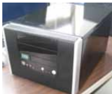
Prototype de 2 e génération de l'analyseur. Le prototype est transportable (environ 8 kg) et mesure 28,5 x 23 x 38 cm (à peu près la taille d'une imprimante).

C'est pour répondre à ces nouveaux besoins normatifs qu'une équipe de chercheurs a mis au point un outil performant de mesure des concentrations dans l'air et des taux d'émissions des matériaux. Deux prototypes transportables (de la taille d'une imprimante) ont ainsi été construits. Reposant sur une méthode brevetée à l'international par le CNRS, et autorisant des mesures en continu, cet analyseur vise une industrialisation rapide grâce à ses qualités : fiable, bon marché, léger et peu volumineux afin d'être facilement utilisé sur le terrain. En pratique, la mesure s'effectue en trois étapes : après avoir piégé le formaldéhyde gazeux en solution, il le fait réagir avec du fluor-al-P et analyse le produit de la réaction par spectroscopie de fluorescence.