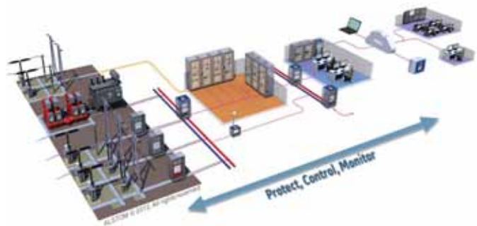
Périmètre technique du projet

Les produits développés seront adaptables à toutes les configurations des réseaux de transport et de distribution, aussi bien pour les marchés de renouvellement que sur les marchés de développement. Destinés aux marchés émergents ou traditionnels, ces produits sont d'autant plus pertinents qu'ils permettront de contribuer aux enjeux de la transition énergétique.