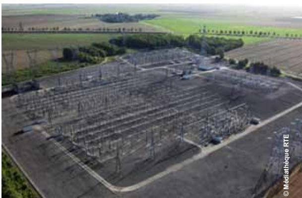
Poste de transformation 400/225/90 kV de DAMBRON