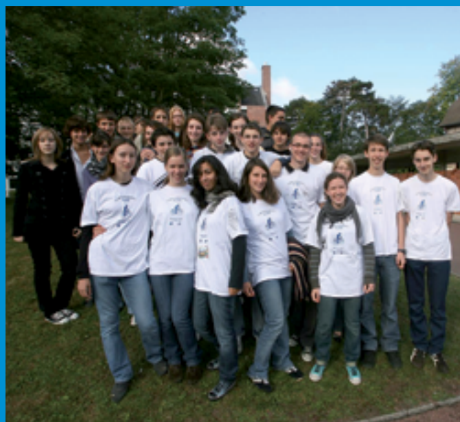
Écomobilité scolaire à Compiègne (60) Plan de déplacements des jeunes du lycée Pierre d'Ailly Journées "Venir au lycée sans voiture" des 18/09/07 et 03/04/08 Source et illustration : Jean-Luc GRANVALLET