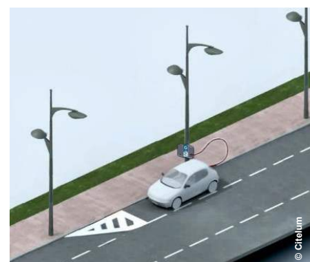
Dispositif de recharge TeleWatt®